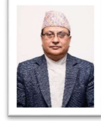
निर्वाचन आयुक्त श्री नरेन्द्र दाहाल